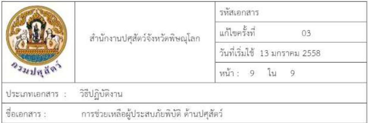
8.2 ผังกระบวนการงาน Flow Chart เรื่อง การช่วยเหลือผู้ประสบภัยพิบัติ ด้านปศุสัตว์