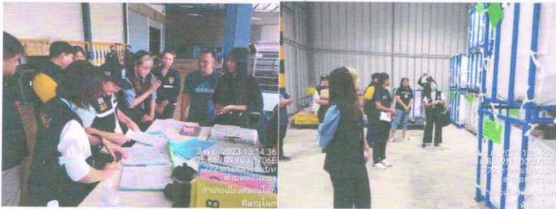
วันที่ ๓ พฤศจิกายน ๒๕๖๖ เข้าตรวจสอบห้องเย็น บริษัท ฟาร์ม ๙ ไก่ฟู้ดส์ จำกัด